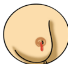
乳頭流出清澈或 帶血的分泌物