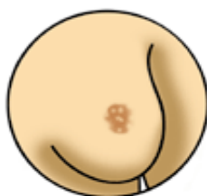
乳頭外形改變 例如乳頭內凹