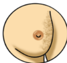
皮膚色澤或 紋路之改變